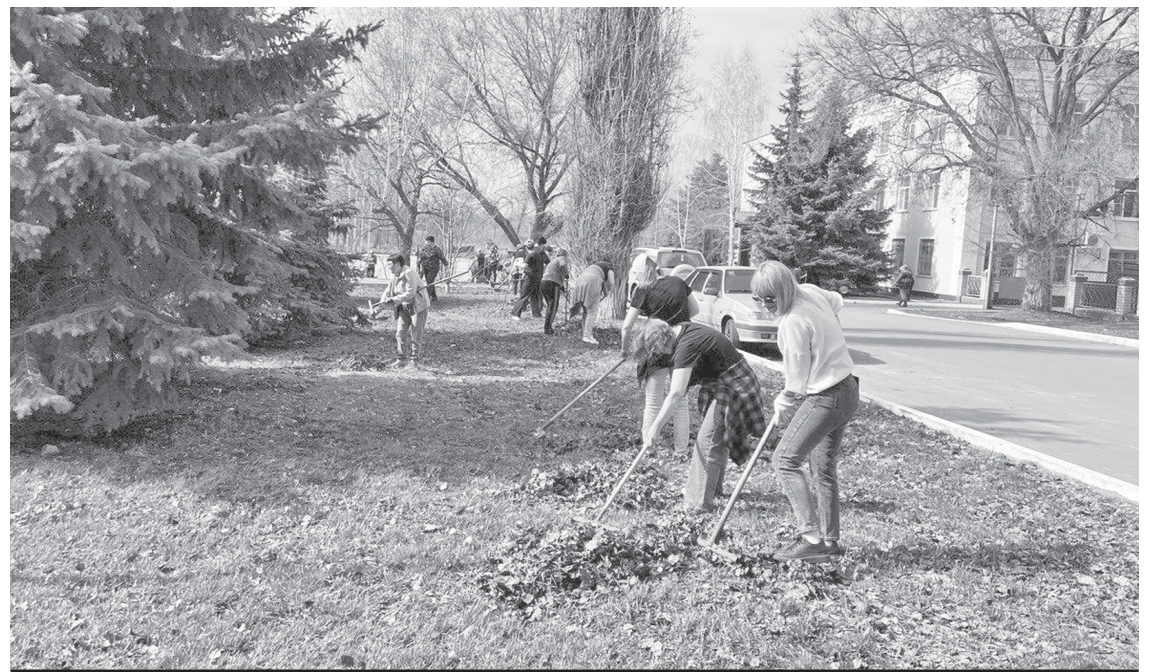
Сотрудники администрации на общегородском субботнике.