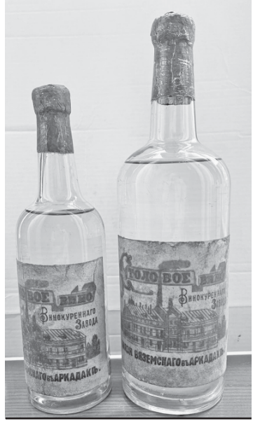
Продукция Аркадакского спиртзавода "хлебное вино".

События, связанные с первой мировой войной, Октябрьской революцией, гражданской войной, неурожаем 1921 года, серьезно повлияли на работу аркадакского спиртзавода. Но, несмотря на все трудности, оно не останавливалось ни на один день.