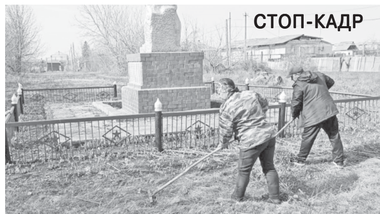
В селе Баклуши прошёл организованный субботник. Сотрудники администрации, сельского Дома культуры, соцработники, школьники убрались в первую очередь на территории, которая считается заповедником села. Работали быстро и слаженно.

БУРЕНИЕ СКВАЖИН в частных и многоквартирных домах. Качественные насосы в наличии. Гарантия. Качество. Рассрочка. Тел. 89372232321, Дмитрий. Реклама.