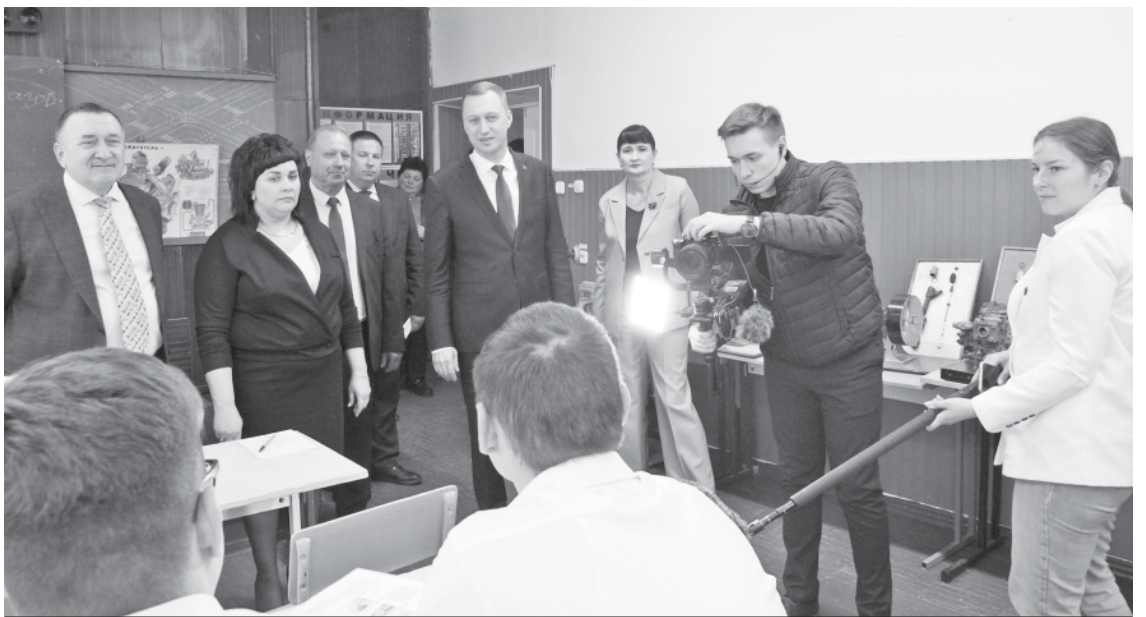
Встреча с руководством и студентами техникума в учебной аудитории.