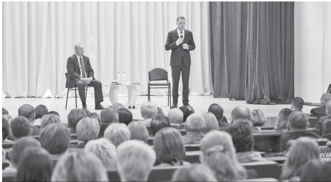
На встрече с жителями Аркадакского района в районном Доме культуры шёл разговор о перспективах развития района.

ком" проблема с растительным мусором. Руководство компании по-прежнему считает, что вывоз растительных отходов не её обязанность. Приводить город в состояние чистоты после вывоза мусора "Ситиматиком" приходится местной службе ЖКХ.