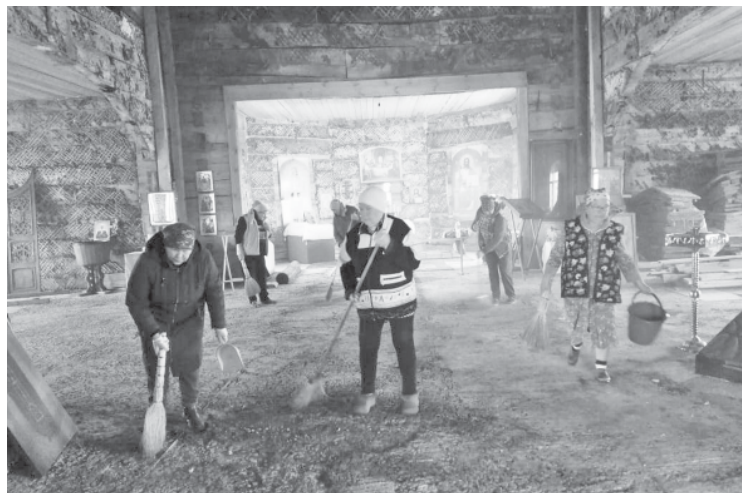
Уборка в храме имени Космы и Дамиана в селе Чиганак.