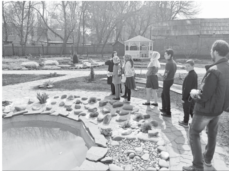
Во время экскурсии в Балашовскую епархию.

В конце дня дети и их родители насладились вкусным ужином, гостеприимно предложенным сёстрами Покровской обители.