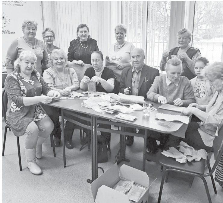
"Серебряные" волонтеры за работой.

Получатели социальных услуг и "серебряные" волонтёры Аркадакского района и изготовили для военнослужащих специальной военной операции "сухой душ", который позволит им ощутить чистоту, так необходимую в полевых условиях их сегодняшней жизни.