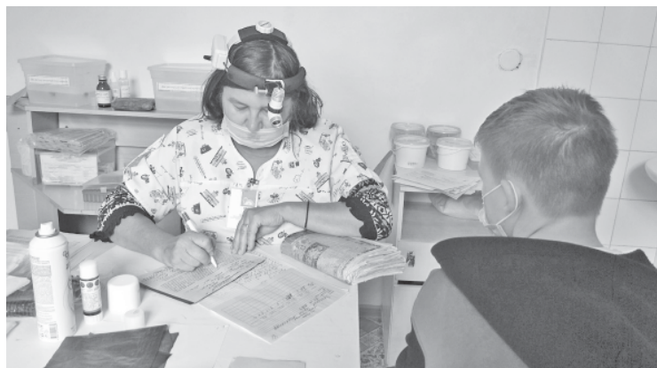
Ведёт приём отоларинголог из областной детской клинической больницы.

Два дня врачи областной детской клинической больницы проводили профессиональные осмотры маленьких жителей нашего района. Приём проходил во врачебных кабинетах педиатрического поликлинического отделения Аркадакской районной больницы.