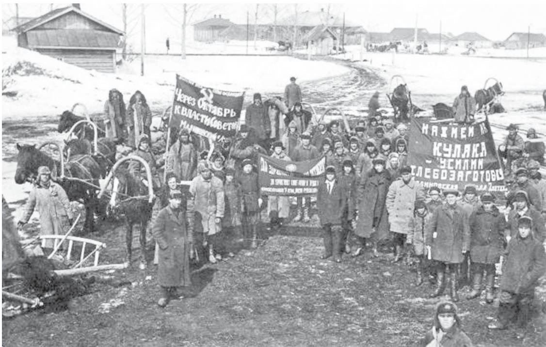
Учащиеся 6-7 классов Малиновской школы везут хлеб, отобранный у кулаков, на приёмный пункт в деревню Крутец.

Выборочные опросы семей показали, что они испытывали недостаток муки, который восполнялся за счёт суррогатов. Исчезли распространённые в сельских семьях продукты: сало, мясо птицы, солёная рыба, творог, яблоки и другие фрукты, свежая рыба, коровье