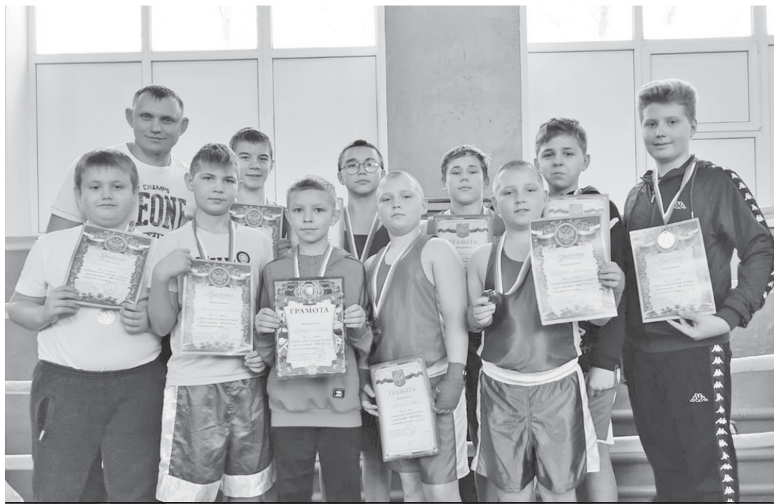
Команда аркадакских боксёров.