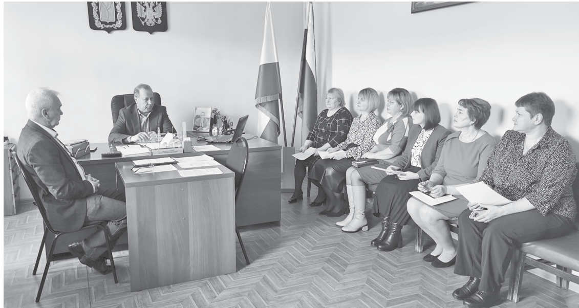
Идёт заседание АТК.

В вышеуказанных законодательных актах содержатся правовые определения и организационные основы противодействия экстремистской и террористической деятельности, в частности под терроризмом понимается идеология насилия и практика воздействия на общественное сознание, на принятие решений органами государственной власти, органами местного самоуправления или международными организациями, связанные с устрашением населения и (или) иными формами противоправных насильственных действий. Экстремизм же представляет собой возбуждение социальной, расовой, национальной или религиозной розни; пропаганду исключительности, превосходства либо неполноценности человека по признаку его социальной, расовой, национальной, религиозной или языковой принадлежности или отношения к религии.