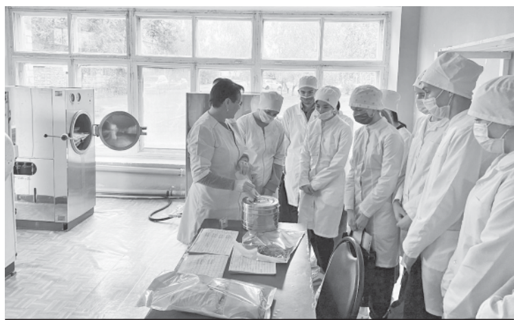
Второкурсники медколледжа в стерилизационном отделении.