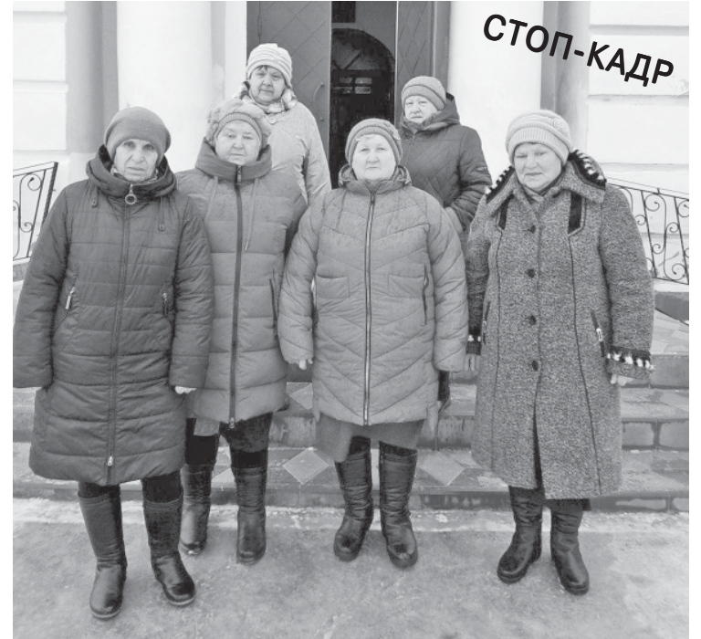
Пенсионеры из Кистендея посетили аркадакский храм. Посещение храма Вознесения Господня в Аркадаке - один из моментов программы для визита кистендейских получателей социальных услуг в Комплексный центр социального обслуживания населения Аркадакского района в рамках технологии "Социальный туризм". Каждый смог поклониться святыням церкви, заказать необходимые службы, а также набрать освящённой воды.

В газете от 9 февраля в материале "На лыжи встали и молодёжь, и взрослые" на четвёртой странице следует читать: "В шестой ступени (16-17 лет) самые лучшие результаты у Ирины Шатской (филиал городской средней школы № 1 в селе Баклуши) и Павла Рябоконе (Ольшанская средняя школа).