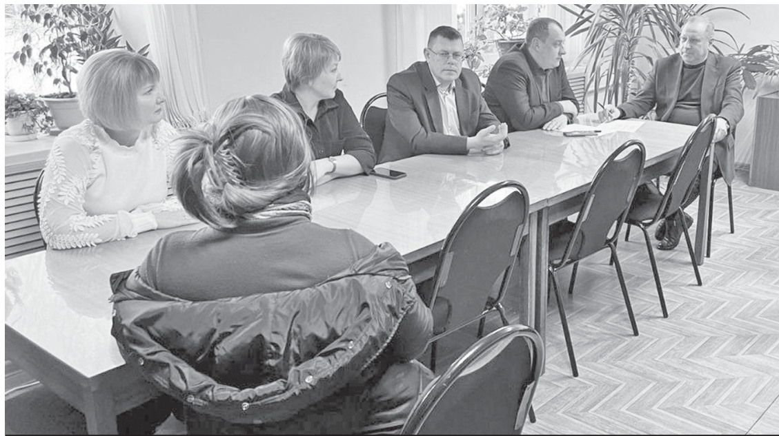
На личном приёме у главы района.