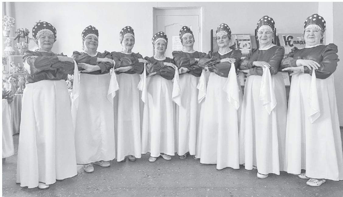
Участницы творческого объединения "Аркадакские бабушки".