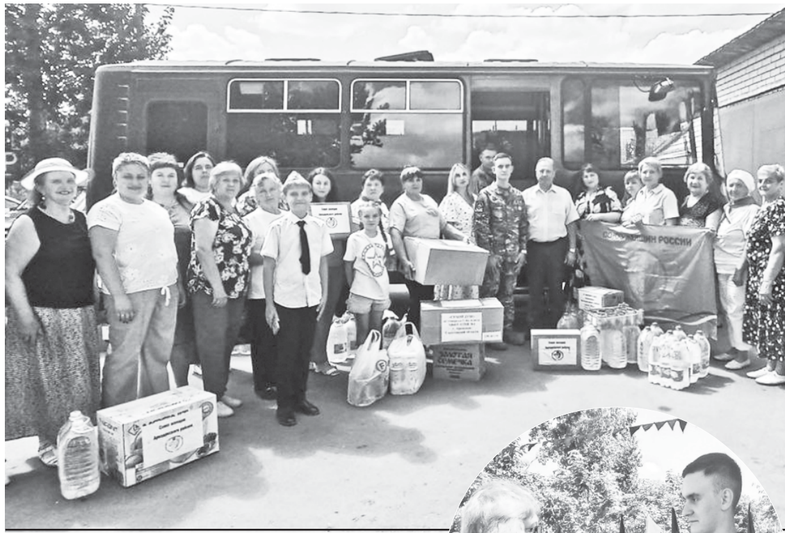
Тёплая встреча с военнослужащими Таманской дивизии.