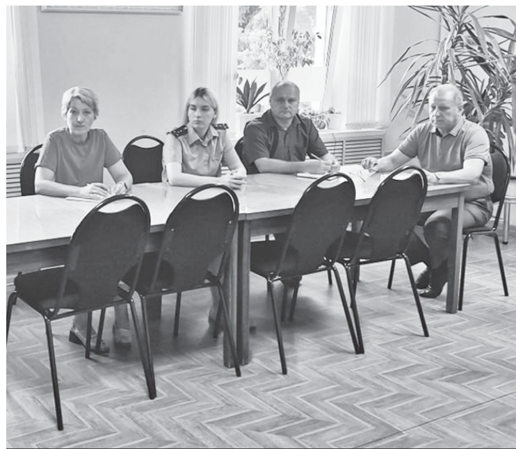
На приёме у главы района.