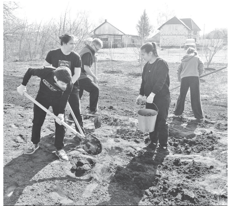
Волонтеры помогают посадить картофель пенсионерам.