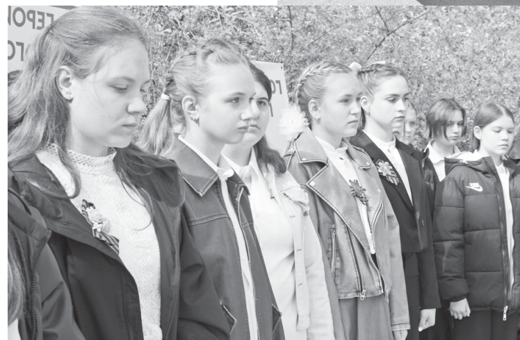
Среди зрителей - учащиеся городских школ.

В год 80-летия Великой Победы накануне празднования 9 Мая прошло торжественное извлечение и прочтение этого послания.