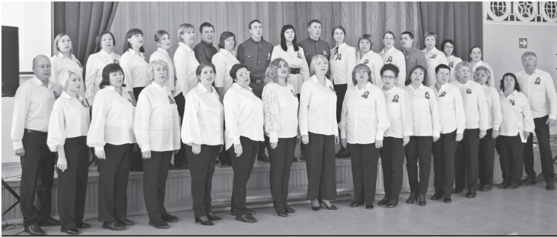
Выступление городской средней школы № 1.