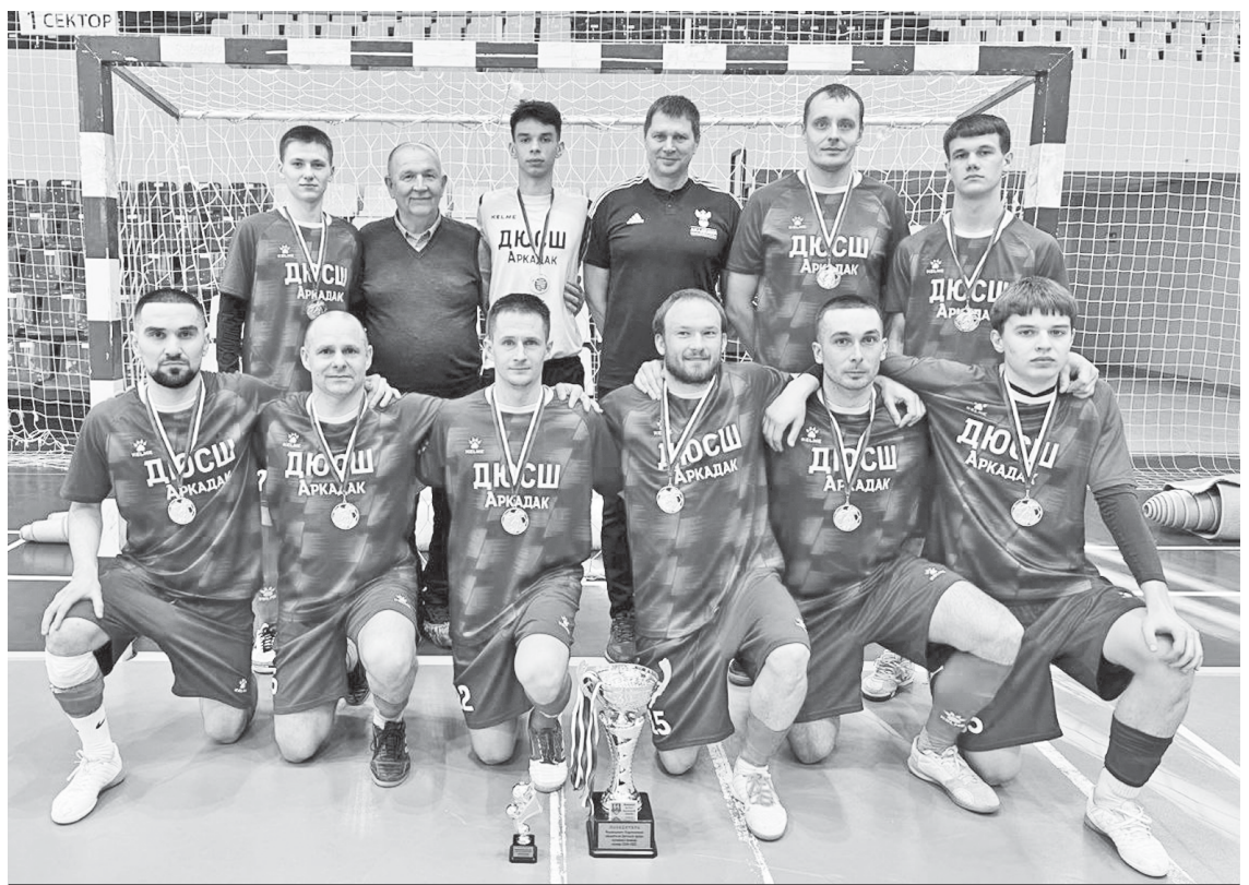
Сборная команда Аркадакского района.