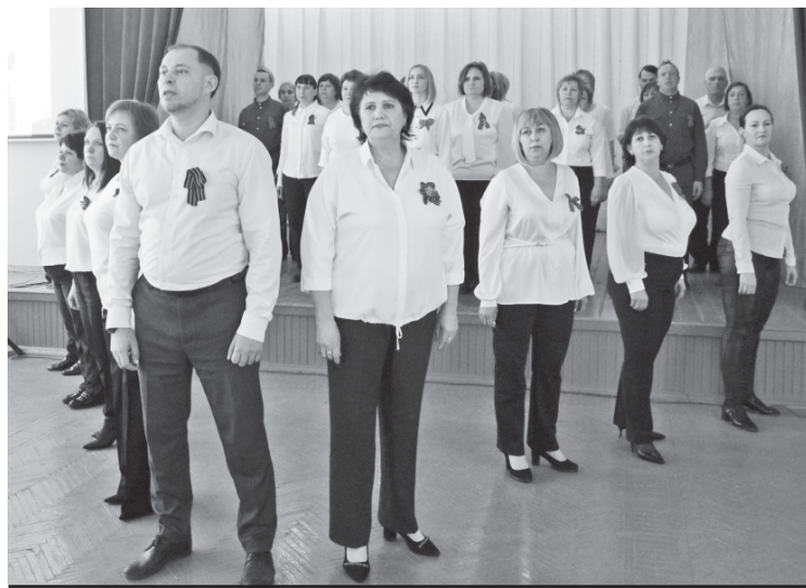
Выступление городской средней школы № 3.

Среди городских школ и учреждений дополнительного образования первое место присуж-