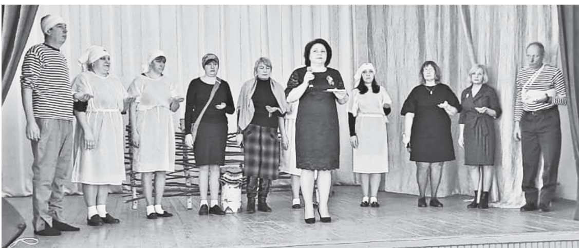
Выступление школы села Красное Знамя.