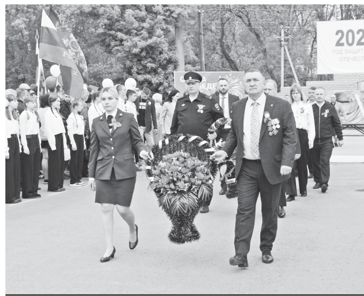
Возложение венков к обелиску погибшим землякам на площади.

- 80 лет назад мы возвестили всему миру о том, что пришла долгожданная Победа, что со-