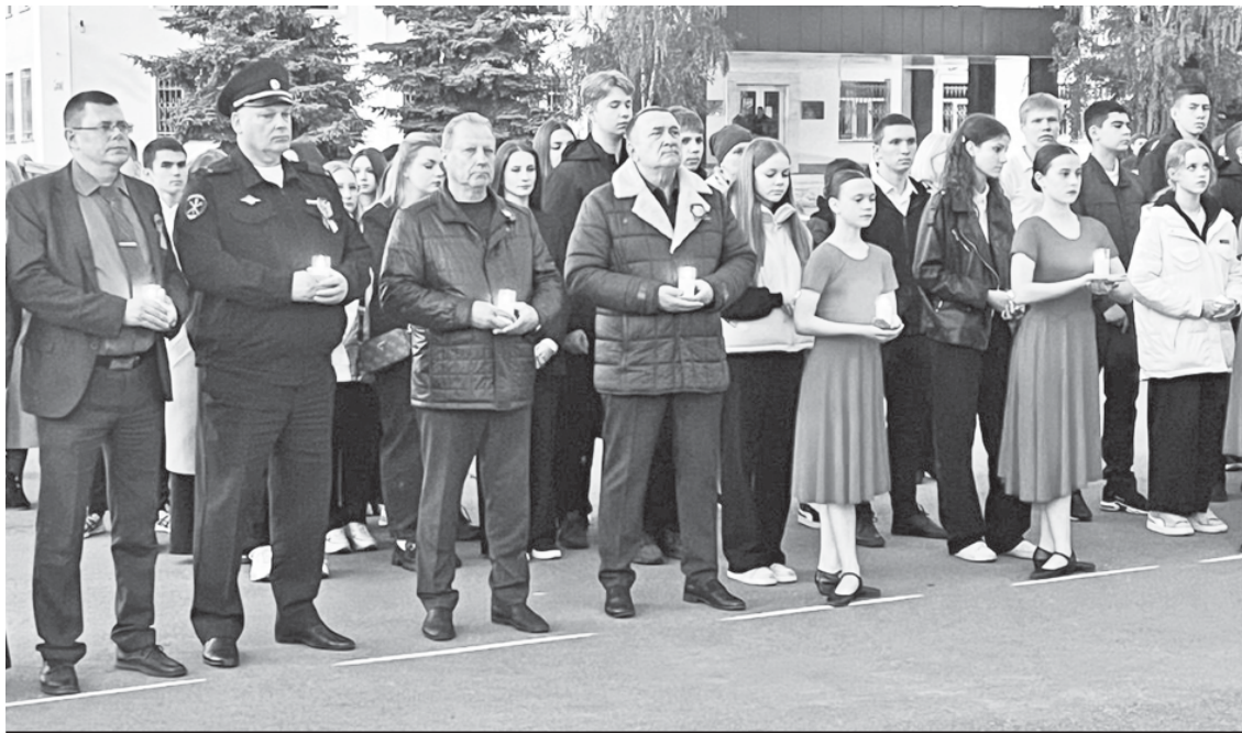
Участники патриотического митинга.