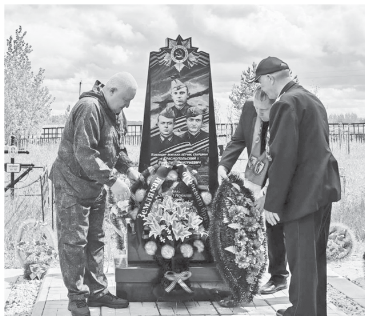
Возложение венков к памятнику.