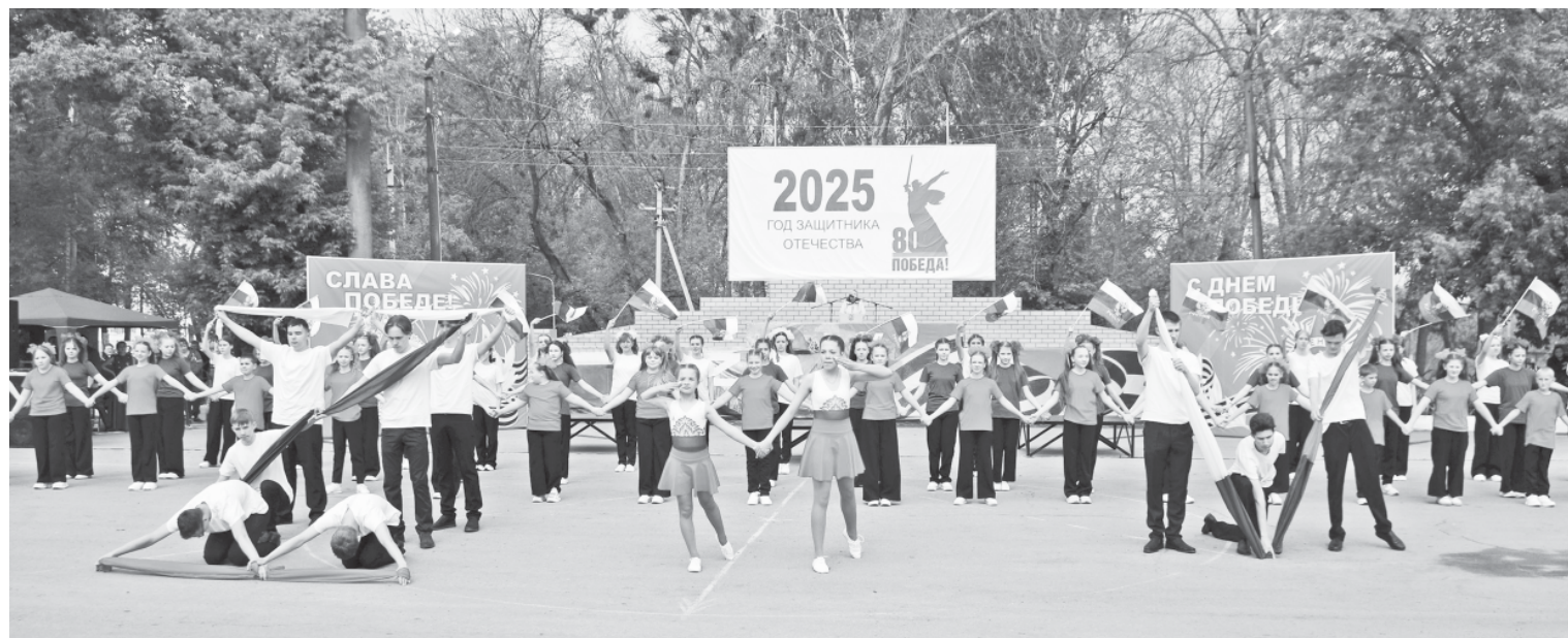
Театрализованная композиция учащихся городской школы № 1.